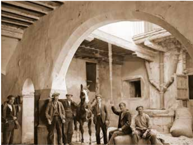
Mesón de la Dolores, h. 1917-1919 (IPCE Wun-2614)

fot. Antonio Passaporte: Calatayud desde el cerro de San Vicente (detalle), h. 1930 (IPCE Loty-5377)